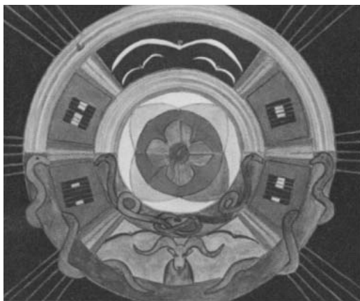
1. ábra: Jung 2011/9. kép

Az 1. ábrán látható mandala szimbólum amplifikációja közben nem a kollektív tudattalan létének bizonyítása a cél, hanem inkább a keresztény és keleti szimbólumokat elemzi Jung, és megállapítja, hogy a beteg szándékosan fordul a keleti szimbólumok segítségéhez. 32 Természetesen Jung szerint az archetipikus szimbólumok a kollektív tudattalan „filogenetikai mélyrétegének” produktumai, de ez a 19. századi organikus memória elméletekkel rokonítható koncepció nem gátolja abban, hogy a kulturális sematizmus jelentőségét is felismerje. 33 A fantáziatermékek vizsgálata több komponensre bontható. A tudatidegen affekciókat a fantázia integrálja a tudatba, de ez a tipizálás teljesen összefonódik a kulturális sematizmus vonásaival. Egy álmaimban felbukkanó szörnyalak idegennek és rémszítőnek tűnik, de ha felébredek már analízissel kibonthatom, hogy vajon milyen traumatikus élmények sűrűtéseként jöhetett létre a szörnyű kiméra, vagy éppen elgondolkozhatok rajta,