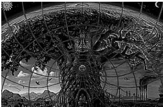
2. ábra: Alex Grey: Gaia

Felmerül a kérdés, hogyan tájékozódhatunk egyáltalán arról, hogy egy kép kialakulása közben affektus transzformáció, affektív sematizmus zajlott? Ha teljesen nem is ragadhatjuk meg az őslátomás vagy az önmagában vett archetípus lényegét, de hatásaiból mégis visszakövetkeztethetünk bizonyos rejtett tartalmakra. A 2. ábrán Alex Grey „Gaia” című festményét láthatjuk, melyet a jelen kontextusban az életfa