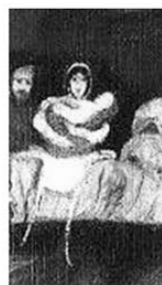
Hídon átvonuló társaság, 1904