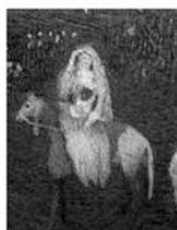
Zarándoklás a cédrusokhoz, 1907