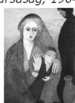
Mária kútja Názáretben, 1908

Úgy vélem, hogy a pszichoanalitikus szemléletű művészetpszichológia ugyanúgy nem hagyhat figyelmen kívül egy ilyen jelenséget, mint az önéletrajzban megjelenő izolált utalást a csecsemőkori elválásztás traumájára. A természetimádat hangsúlyozása mellett az anya–gyermek ábrázolások gyakorisága is arra utalhat, hogy a festő fantáziájában megjelent a megszakadt duálunió helyreállításának