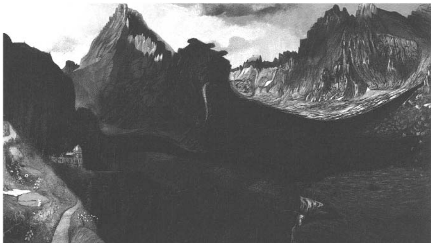
A Nagy-Tarpatak a Tátrában

barátságos távlatok kedvelésével leírható, korai eredetű tárgykapcsolati attitűd, és szembe állítható a tárgyhoz ragaszkodó és a tapintással összefüggésbe hozható oknofiliával, amellyel egyébként közös törőlfakad (Bálint, 1997). A filobata attitűd tükröződik Csontváry hegyek és hatalmas panorámák iránti vonzalmában is, amit a Nagy-Tarpatak a Tátrában és a Taorminai görög színház romjai című festményeken is megcsodálhatunk. A filobata kockázatvállaló, szembe néz az útjában álló akadályokkal, a viharral, széllal, vadállatokkal, ellenességgel. Vészhelyzetben azonban rögtön talál egy „oknofil tárgyat, amelybe belekapaszkodhat, a amely megmenti őt. Veszélyhelyzetben képes kell, hogy legyen oknofiliájának mozgósítására.” (Reverzy, 2010, 22.). Nem lehetetlen, hogy a festő ecsetje is ilyen oknofil tárgy, amelybe bele lehet kapaszkodni, miközben a szelf fuzionál az (anya)természet által megjelenített tárggyal. A folyamat mintha a mahleri újraközeledési krízist (Mahler 1974), annak egy lehetséges megoldását idézné, vagyis azt, hogy hogyan lehet visszatérni a szimbiózis „óceáni érzésébe” anélkül, hogy az az én megsemmisülésével fenyegetne. A regresszió optimális esetben így az én szolgálatába állítható, és az inspirációs folyamat bázisát alkothatja (Kris, 2000). Csontváry esetében a regresszió részben az én szolgálatába állott (kreativitás), részben viszont károsította is azt (pszichózis).